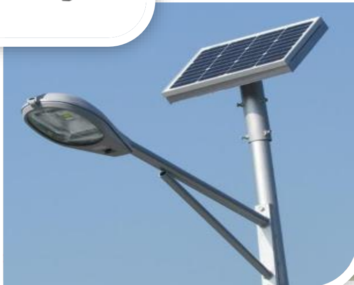
Sistemas Solares para Iluminación Externa