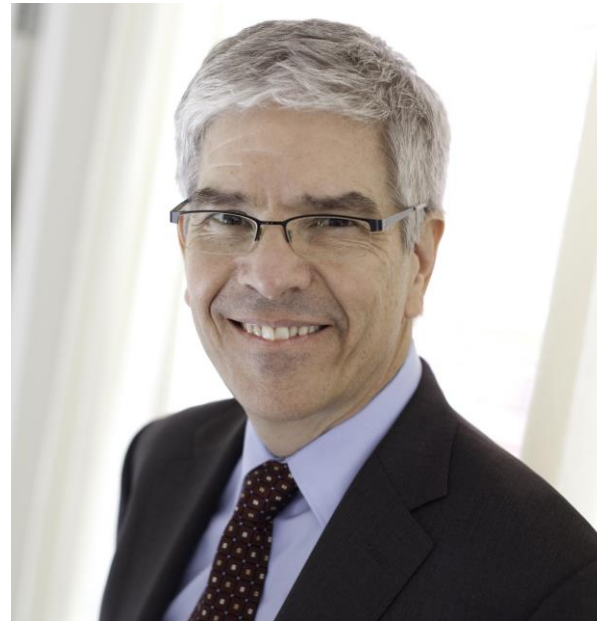
Paul M. Romer Premio Nóbel de Economía 2018